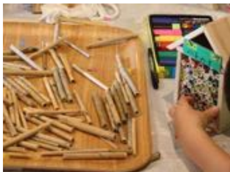
産卵場所になるパイプを詰め