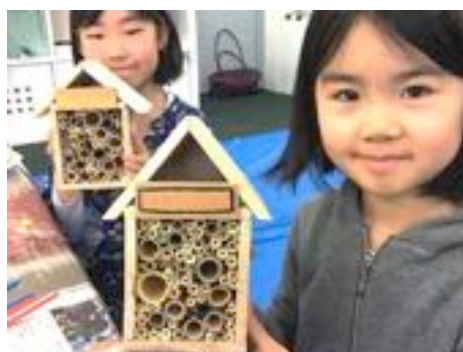
ハチのおうちの出来上がり