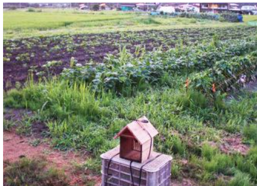
はしもと農園のアシナガバチハウス

すぐに体が反応しないので気付かずにいる人が日本には4人に一人いるとされます。私もその一人だったということです。