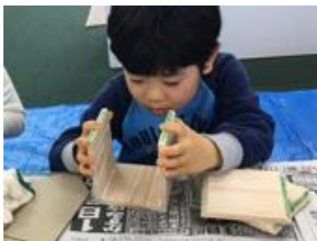
木工用速乾ボンドで家を作って