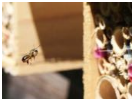
その後、8種類の蜂たちが産卵していきました!